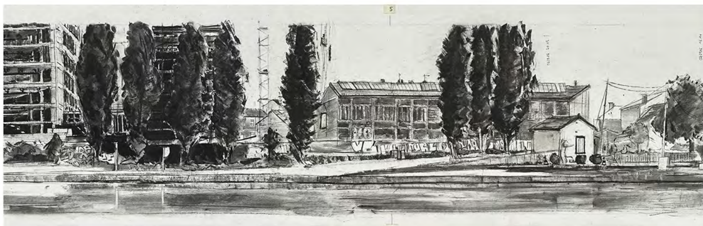
Extrait, niveau limite Bobigny 5/30

"La composition progresse et se déroule dans le temps, comme dans un poème ou comme dans une pièce de musique" (Pierre Ryckmans).